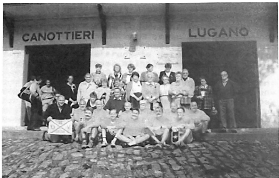
Nach dem Rudern Wimpeltausch vorm Bootshaus