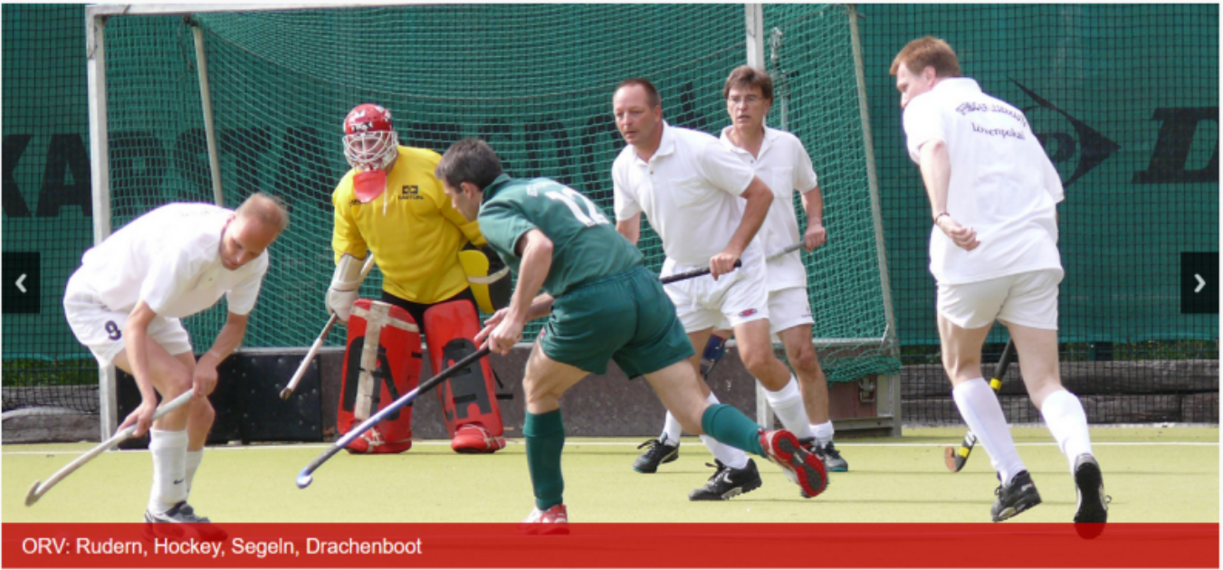
ORV: Rudern, Hockey, Segeln, Drachenboot

Slideshowbilder werden auf ausgewählten Seiten direkt unter dem Menü angezeigt, stehen mehrere Bilder zur Auswahl, werden diese nacheinander eingeblendet. Die Reihenfolge wird über die Bilderverwaltung vorgegeben.