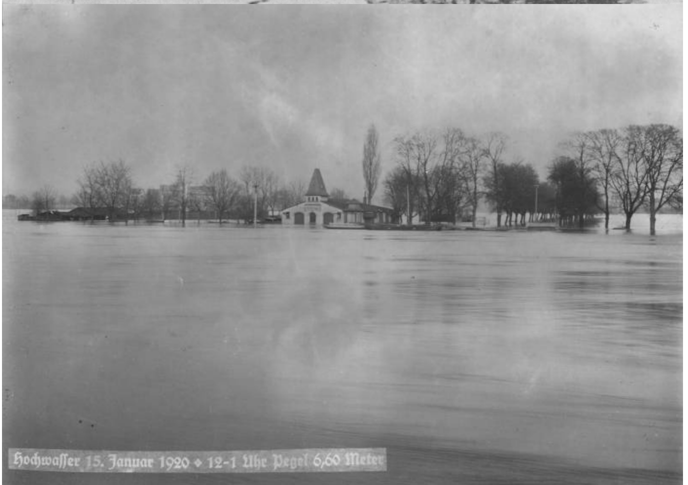
Hochwasser 15. Januar 1920 ♦ 12-1 Uhr Pegel 6,60 Meter