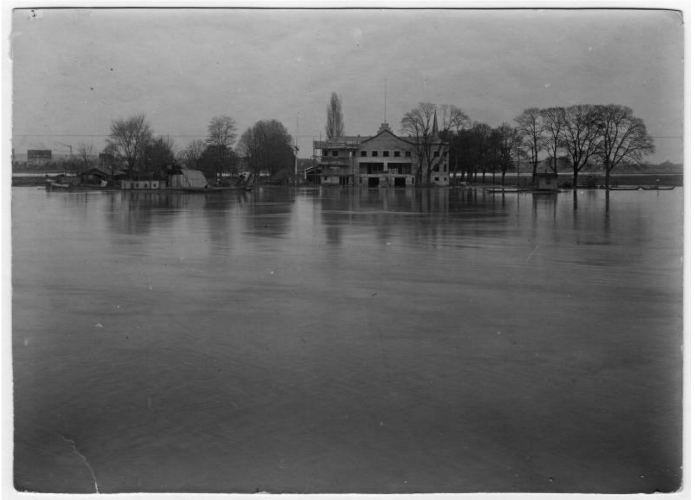
Die erste Bewährungsprobe noch während des Baus