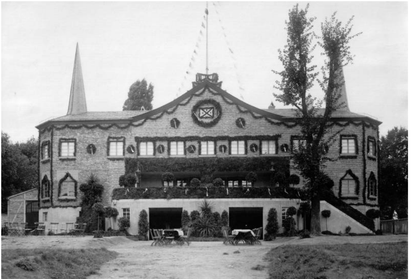
Das Neue Bootshaus am Tag der Einweihung