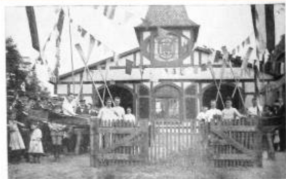
Bootstaufe beim Offenbacher R.V. von 1874.