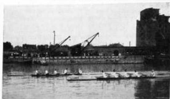
Münchener R.V. Bayern in Mannheim. Kampf im Badenia-Vierer bei 1500 m mit Offenbacher Ruder-Verein, der mit 1 m Differenz siegte.