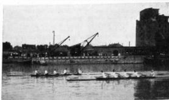
Münchener R.V. Bayern in Mannheim. Kampf im Badenia-Vierer bei 1500 m mit Offenbacher Ruder-Verein, der mit 1 m Differenz siegte.