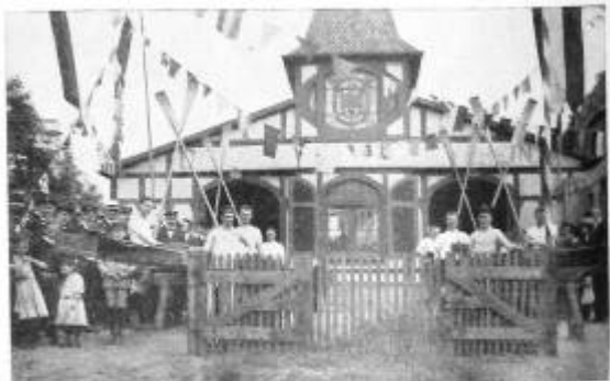
Bootstaufe beim Offenbacher R.V. von 1874.