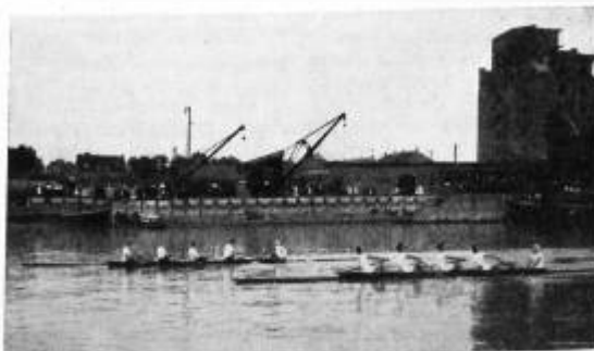
Münchener R.V. Bayern in Mannheim.