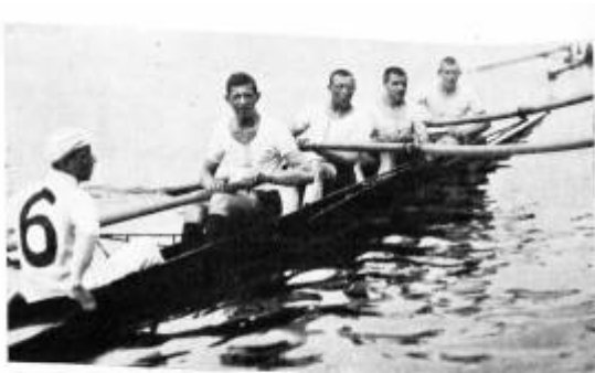
Junior-Vierer des Offenbacher R.V. v. 1874.